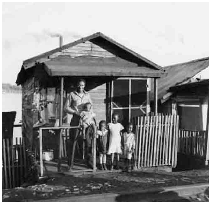
Hooverville, riverfront, St. Louis, 1931

Se llamaron Hooverville en honor (dudoso honor) a Herbert Hoover , presidente de los Estados Unidos entre 1929 y 1933 y, por tanto, máximo responsable de la deriva que sufrió el país hasta llegar a la Gran Depresión .