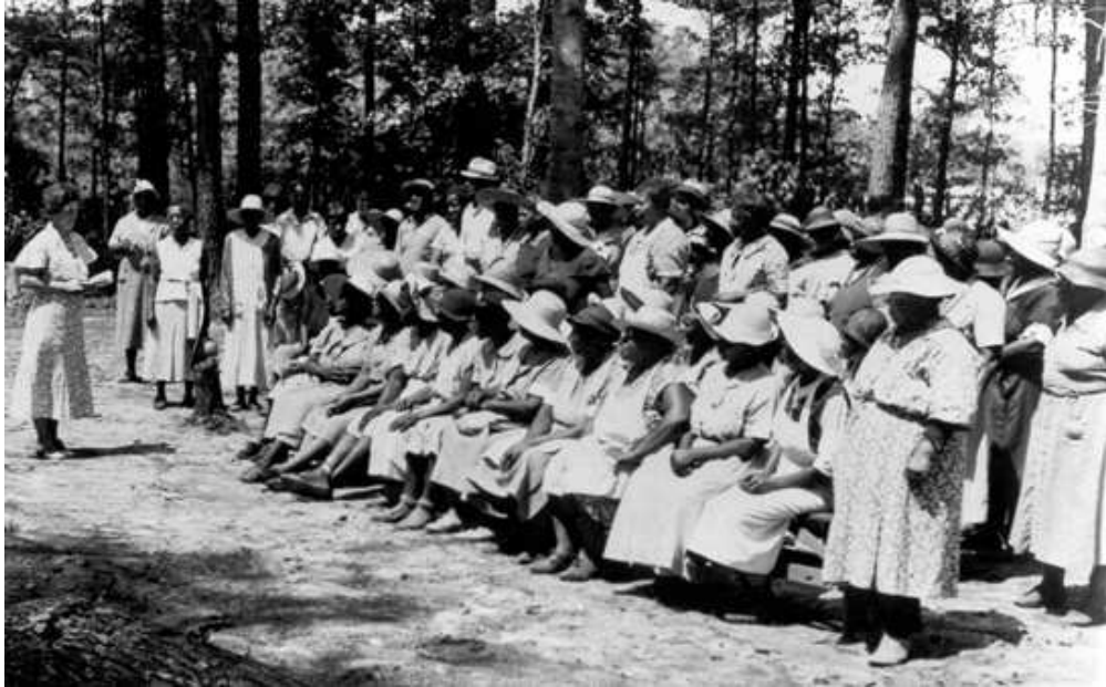
WPA workers in the Norfolk Botanical Garden, 1938

Otra de las críticas de la WPA se debía al carácter muchas veces inútil de gran parte de los proyectos: se daban casos tan llamativos como que la WPA pagase a una cuadrilla de trabajadores para que abriesen una zanja; una vez abierta, pagaba a otra cuadrilla para que la tapase; a continuación, se contrataba a otra cuadrilla para volverla a abrir; y así durante años, por el simple hecho de tener ocupados a los trabajadores.