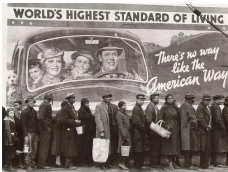
"There's no way like the american way", Margaret Bourke-White 1937