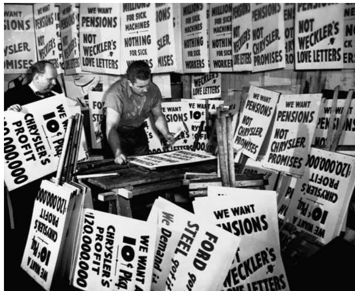
Signs for Chrysler Workers' Strike, 1950

Oh Lord, oh Lord, baby : What in the world gonna become of me? I don't know, I don't know, baby Lord, Lord, Lord : What in the world gonna 'come of me? These hard times, hard times, baby : 'Bout to get the best of me You know Paul Chrysler, God knows : Been under for ninety days already Was one thing, now people : Lord, I sure can't understand at all What in the world gonna become of me? : This doggone strike soon It's gon' become over, people : God knows my life can't last any longer I go to the welfare : This is what the welfare said "Look at here now, man, one type-a, a-beans : And one can-a tripe", I said, "No" God know that will never do : If Paul Chrysler will soon end this strike God knows, God knows : I don't know what I'm gonna do