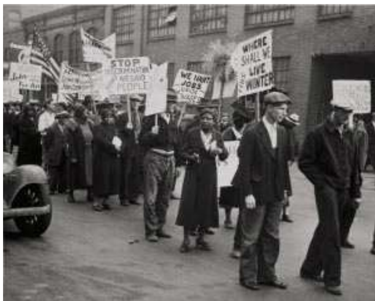
Unemployed march, Pine Street, during Great Depression. Ralph A. Ross, 1931

Esta situación tocó a su fin en 1933, un año después de la publicación de la canción de 'Hi' Henry Brown , cuando las trabajadoras negras se declararon en huelga, la llamada The 1933 Funsten Nut Strike , reclamando un salario justo e igualdad de condiciones entre blancos y negros. Tras ocho días con las fábricas paradas, el patrón aceptó las exigencias de las trabajadoras.